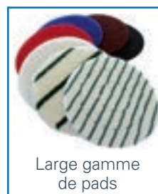
Large gamme de pads