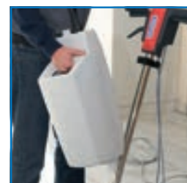
Montage et démontage simple du réservoir à lessive (option)