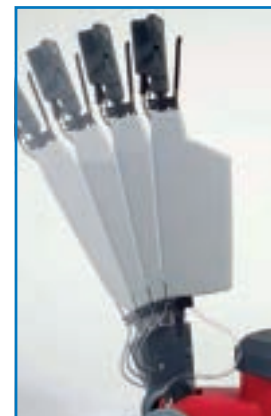
Ajustable dans toutes les positions, en option avec réservoir à lessive