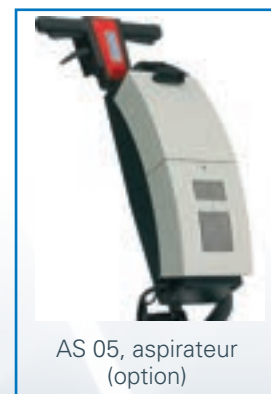
AS 05, aspirateur (option)