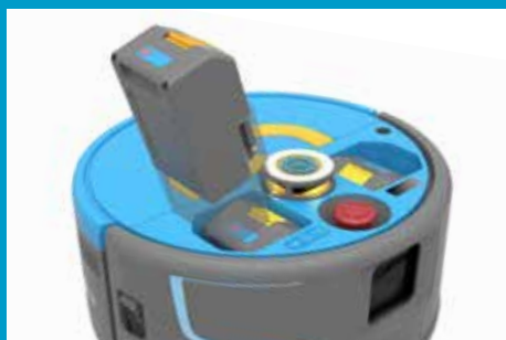
Batteries rechargeables et interchangeables.