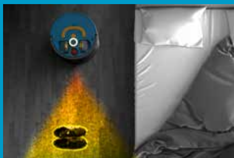
Navigation et détection laser pour la précision.