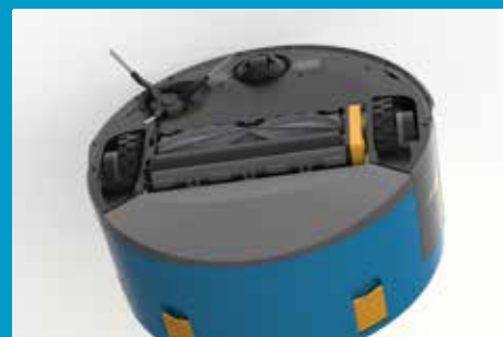
Brosse double à ressort pour un nettoyage parfait, même sur les sols irréguliers.

Pour plus d'informations sur notre co-botic 1900, visitez : i-teamglobal.com