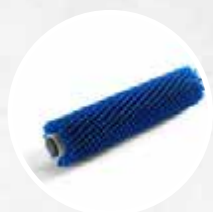
BROSSE CYLINDRIQUE EN POLYPROPYLÈNE BLEUE cod. 40.5000.00