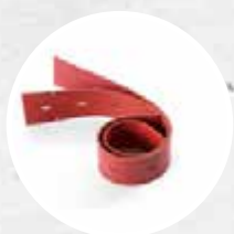
KIT DE CAOUTHOUCS (avant/arrière) cod. 96.0085.00