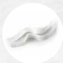
CAOUTCHOUCS AVANT/ARRIÈRE EN POLYURÉTHANE (avant/arrière) cod. 96.0084.00