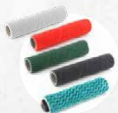
PADS CYLINDRIQUES BLANC cod. 40.5000.11 ROUGE cod. 40.5000.12 VERT cod. 40.5000.13 NOIR cod. 40.5000.14 MICROFIBRE cod. 40.5000.04**