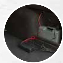
CHARGEUR DE BATTERIES AUTO 24-12 V 3 A cod. 18.0065.00