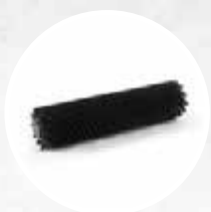
BROSSE CYLINDRIQUE EN TYNEX GRIT 360 cod. 40.5000.03