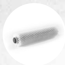
BROSSE CYLINDRIQUE EN POLYPROPYLÈNE (SOUPLE)