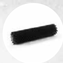
BROSSE CYLINDRIQUE EN TYNEX GRIT 80 cod. 40.5000.08