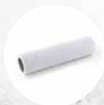
PAD CYLINDRIQUE MÉLAMINE cod. 40.5000.10