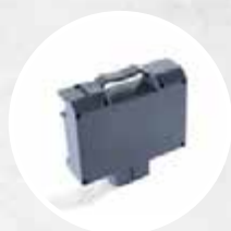
VALISE BATTERIES LITHIUM 24V 280 WH (pour version 10 Ah) cod. 22.0571.00