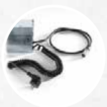
CHARGEUR DE BATTERIES 24 V 10 A cod. 22.0619.01