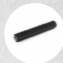
PORTE PADS CYLINDRIQUES cod. 40.5000.06