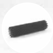
BROSSE CYLINDRIQUE EN POLYPROPYLÈNE (DURE)