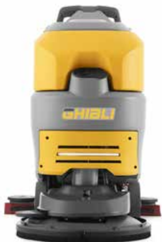
REXA 50 D 55 CHEM, le modèle tracté avec brosse simple de 21"

La gamme Rexa 50 comprend quatre modèles différents d'autolaveuses à conducteur accompagnant :