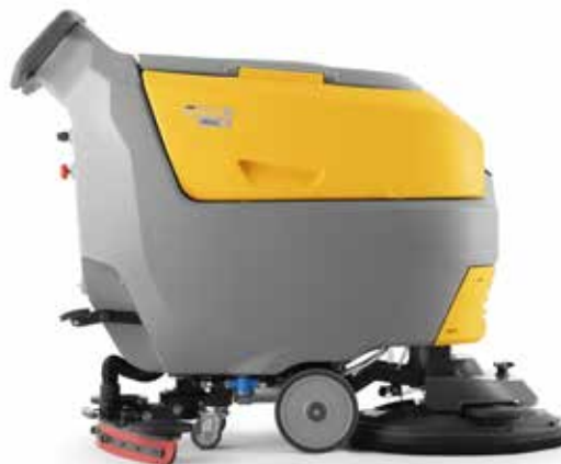
REXA 50 SD 55, le modèle tracté, en version simplifiée, avec brosse simple de 21"

Rexa 50 dispose d'un puissant moteur d'aspiration à haut rendement qui garantit d'excellentes performances avec une faible consommation d'énergie , tandis que la poignée ergonomique et le pratique Touch System à double capteur intégré permettent un contrôle précis de la machine , rendant chaque séance de travail plus facile et plus confortable. Tous les modèles sont disponibles dans différentes configurations, avec des batteries au gel ou au lithium, pour garantir des résultats de nettoyage inégalables et une grande autonomie de travail .