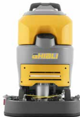
REXA 50 D 60 CHEM, le modèle tracté avec tête à deux brosses de 24"