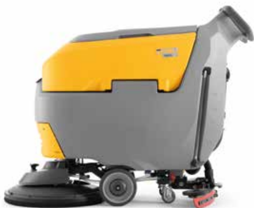
REXA 50 SM 55, le modèle manuel, en version simplifiée, avec brosse simple de 21"