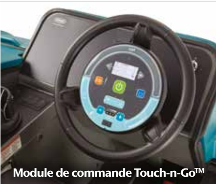
Module de commande Touch-n-Go™