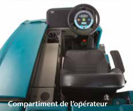
Compartment de l'opérateur