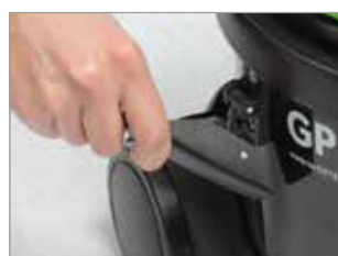
ATTACHES EXTRÊMEMENT SOUPLES