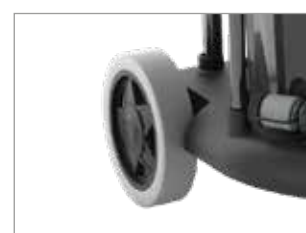
GRANDES ROUES ARRIÈRE ANTI-TRACE