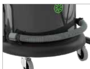
TUYAU DE VIDANGE