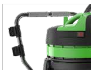
CHARIOT AVEC POIGNÉE