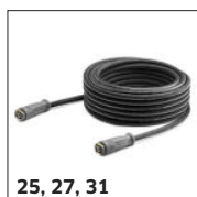
25, 27, 31